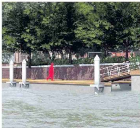
EX RARI NANTES Sedici posti barca al posto dell'ex piscina alla ferrovia in un rendering del Comune

ANCORA FERMI GLI ALTRI PROGETTI: BURANO, MURANO S.ERASMO, MALAMOCCO PELESTRINA E SAN PIETRO IN VOLTA