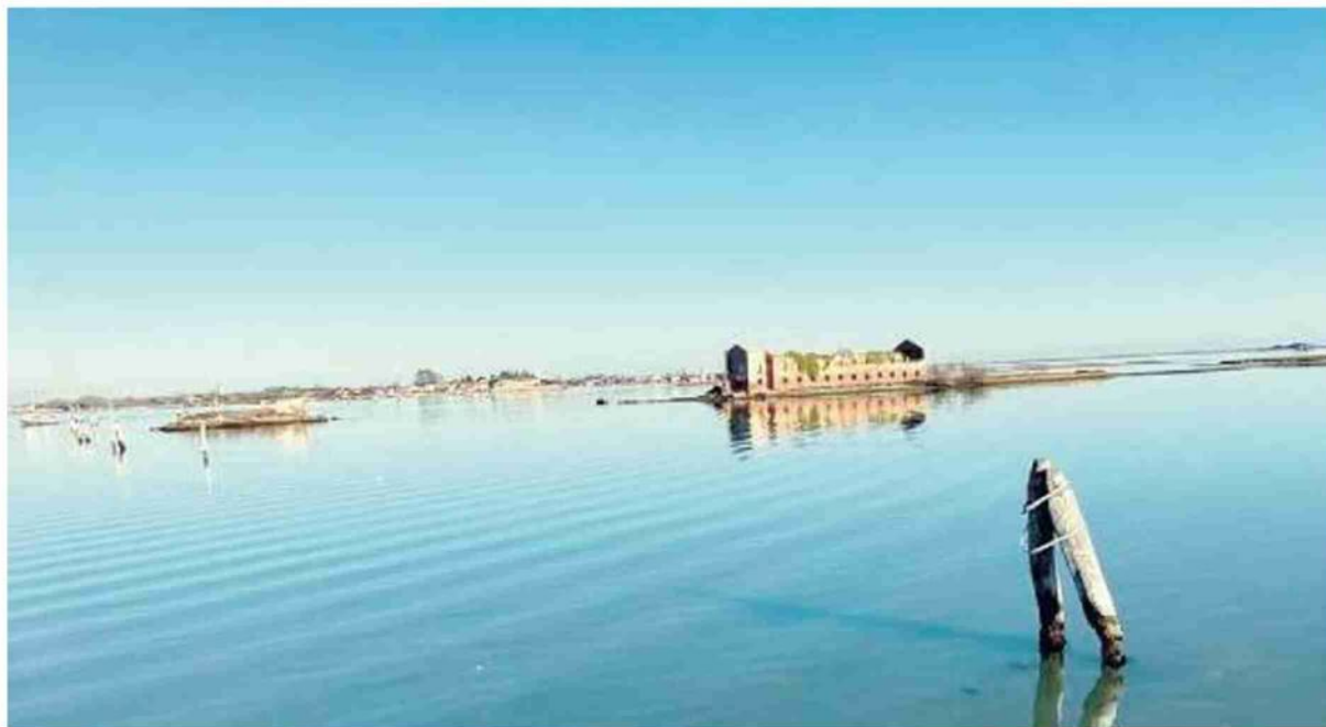
BURANO Il canale del Bisato segnalato da boe artigianali messe dai pescatori per non perdere la strada